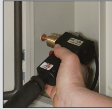
Anwendungsbeispiel Schaltschrankbau Example of use Switchboard construction